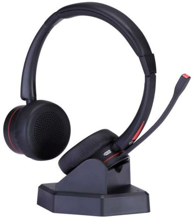
D&C 890BT D