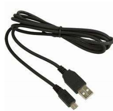
Cordon Micro USB/USB