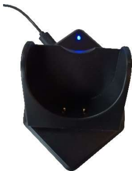
Socle de chargement