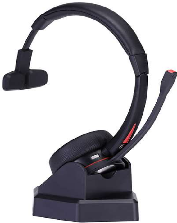
D&C 890BT M